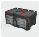
3 fiókos tároló 3-Set Organizer