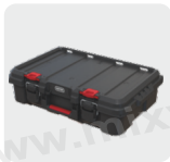
Komplex rendszerező láda Power Tool Case