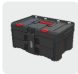
2 fiókos tároló 2-Drawer Unit