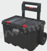
21" gurulós szerszámos láda | Cart