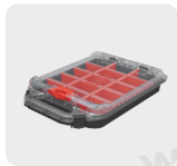
Kicsi rendszerező tároló Half footprint Organizer