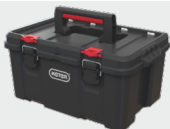
21" szerszámos láda | Tool box